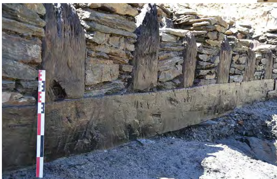
Détail du quai de Ratatum Époque gallo-romaine (1er siècle) Chêne et micashiste Ville de Rezé

Fait exceptionnel, l'un des quais gallo-romains de Ratatum , la cité antique de Rezé, a été découvert en juin 2011. Il a survécu pendant près de 2000 ans aux assauts du temps et de la dynamique fluviale de la Loire. Réalisé avec un assemblage parfait de bois de construction en chêne et de pierres de micashiste, ce quai monumental a une longueur de 150 m. Cette découverte faite pendant les fouilles programmées de 2011 présente un caractère inédit pour les archéologues. Grâce au travail du laboratoire Arc'Antique, un moulage partiel du quai en résine a pu être réalisé. Il sera l'une des pièces maîtresses de l'exposition.