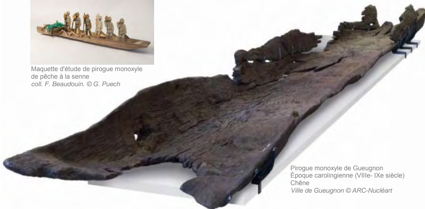
Pirogue monoxyle de Gueugnon Époque carolingienne (VIIIe- IXe siècle) Chêne Ville de Gueugnon

Le convoiement de la pirogue qui arrive depuis Gueugnon le 22 mai 2012 au matin à Rezé constitue un événement exceptionnel lors du montage de l'exposition. Elle est le premier objet à être installé. Il faudra d'innombrables précautions pour la transférer à l'aide d'un chariot depuis la semi-remorque qui l'aura transportée. Un engin élévateur la montera ensuite au premier étage de la Galerie Diderot dans sa structure métallique construite à cet effet. Ce n'est qu'après la pose de la pirogue que l'ensemble de la scénographie et des autres objets pourra être disposé autour de cet élément central de l'exposition.