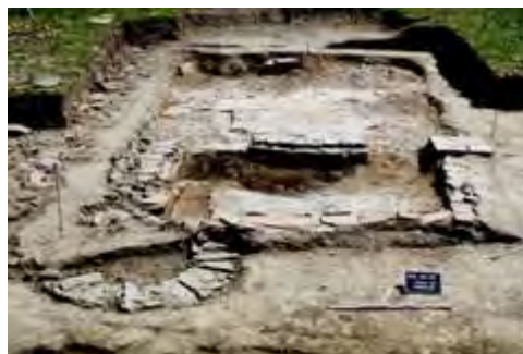
Grand séchoir du milieu du II e siècle

Un large four et un séchoir à céréales de grande envergure daté des années 120/150 nécessitent encore une étude comparative. En dehors des déchets cendreaux, nous n'avons pas récolté de rebus de cuisson ou de ratés qui nous auraient éclairés sur la fonction exacte de cette installation artisanale. Un puits a également été découvert sur le même secteur et une série de foyers, plus ou moins alignés, ont été mis au jour dans les parties sud du site.