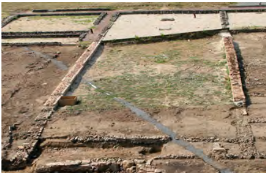
Entrepôt du port antique en cours de restauration

En 2010, l'entreprise Softage a été missionnée pour consolider, restaurer et valoriser les vestiges mis au jour depuis 2005 et sortis de l'étude ainsi que la chapelle Saint-Lupien. Il s'agit à la fois de protéger les vestiges et de les rendre lisibles pour le public. Ce programme de valorisation s'inscrit dans la politique patrimoniale générale de la Ville de Rezé et en particulier dans la création d'un Centre d'Interprétation et d'Animation du Patrimoine, qui devrait s'implanter sur le site et offrir notamment un parcours archéologique extérieur sur près de 5000 m 2 .