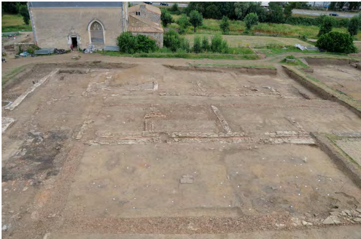
Vue prise en nacelle du secteur sud ouvert en 2010 : rue, foyers artisanaux, entrepôts et probables thermes restent à être analysés

S'appuyant en partie sur les aménagements de la berge, ce bâtiment probablement thermal témoigne d'une évolution fonctionnelle du quartier Saint-Lupien dans les années 120-150 de notre ère. Fort bien conservé (élévation sur plus de 2 mètres de haut), cet édifice est l'un des rares témoignages de la parure monumentale de la ville de Ratiatum . Un autre bâtiment situé au sud de la chapelle présente des hypocaustes (pilettes en brique assurant un chauffage par le sol) qui pourrait appartenir à un autre bain public.