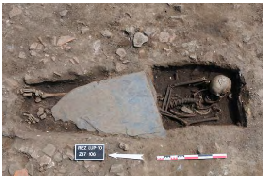
Sépulture inscrite dans un coffrage de schiste

En 2010, de nombreux aménagements médiévaux ont été mis au jour, ils semblent liés à l'implantation de la chapelle Saint-Lupien au début de la christianisation de notre territoire. Au-delà du bâti complexe et souvent remanié, une nécropole importante a déjà livré une quarantaine d'individus matures et immatures ayant connu des modes d'inhumation très variés.