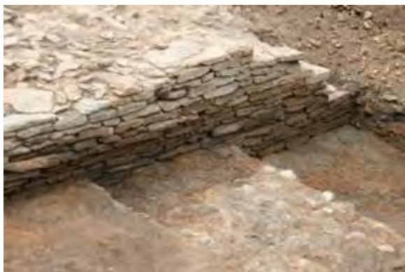
Large mur de terrasse daté du I er siècle de notre ère sur lequel vient s'appuyer une cale portuaire

Au nord de cette façade monumentale, plusieurs niveaux de remblais ont été remarqués dès 2005. Ils recouvraient en fait des états de remblaiements antérieurs ayant servi à la mise en place de sols grossiers et/ou niveaux de circulation ; pente du sud vers le nord, possible cale, précédée par une simple pente. Cette cale date du premier quart du III e siècle sans que l'on connaisse précisément l'état des murs à cette époque là.