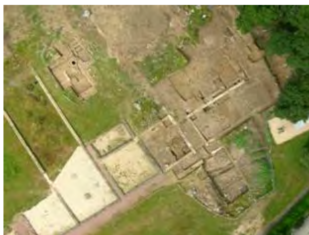
Vue aérienne des axes de circulation et des entrepôts portuaires

Les marchandises qui y étaient déposées ne sont pas identifiées. Par son type de plan et ses dimensions, cet entrepôt pouvait tout aussi bien servir de c h a i que de bâtiment de s tockage de céréales. Les vestiges étant très arasés, il est très difficile, pour le moment du m oins, de l e s définir plus précisément.