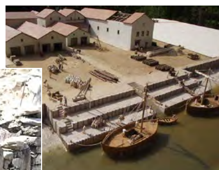
Maquette du port antique de Rezé Ville de Rezé © Artudupetit

Sur les éléments en bois sont gravés une série de chiffres romains, témoins de l'assemblage.