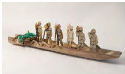
Maquette d'étude de pirogue monoxyle de pêche à la senne coll. F. Beaudouin.

Taillée dans une seule bille de chêne, la pirogue mesure près de 9 mètres de long et a certainement été construite pour la pêche à la senne. Pas moins de 25 ans se sont écoulés entre sa mise au jour et sa restauration. La pirogue de Gueugnon est aujourd'hui l'un des rares exemples de bateaux du haut Moyen-Âge conservés et classés à l'inventaire supplémentaire des monuments historiques (ISMH) depuis 2008.